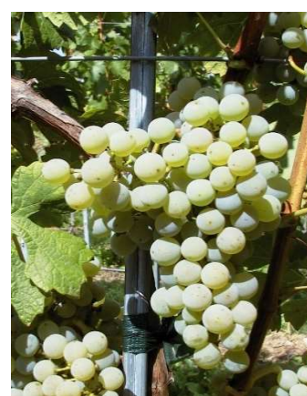
Cabernet Blanc (S)