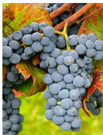
VB: Cal. 1-28 (S)