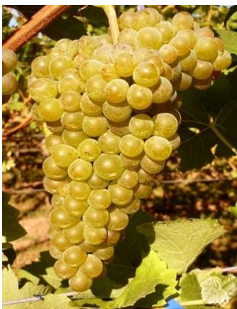
Solaris (variété protégée=S)