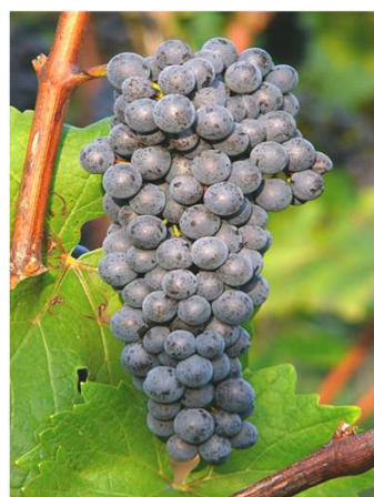
Cabernet Jura (S)